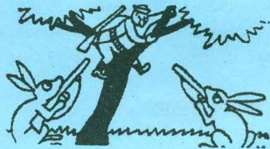
- Le cauchemar du chasseur -