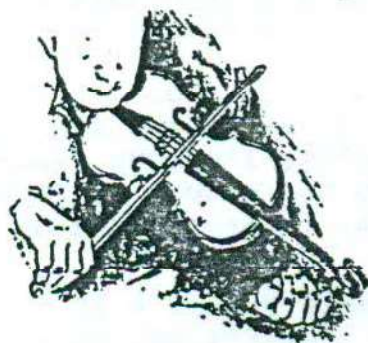
S'accorder sur Dieu