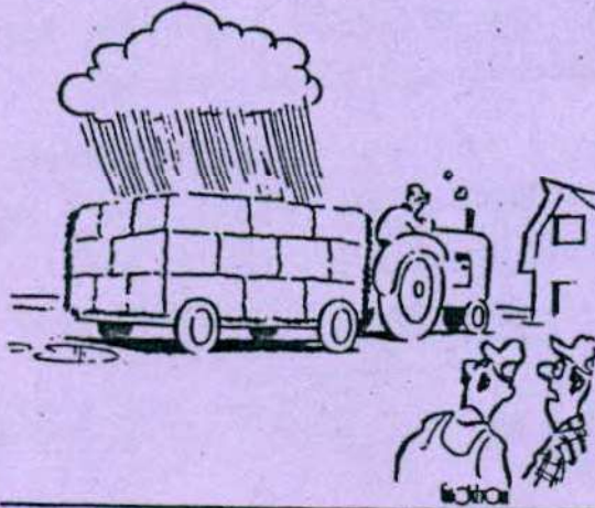
C'est vraiment l'agriculteur le plus malchanceux que je connaisse!