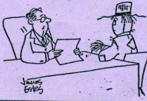
- Vous trouvez les travaux des champs épouvantables?