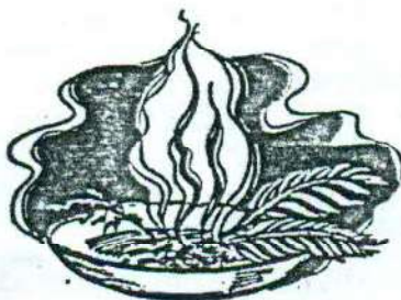
Se savoir tout par grâce