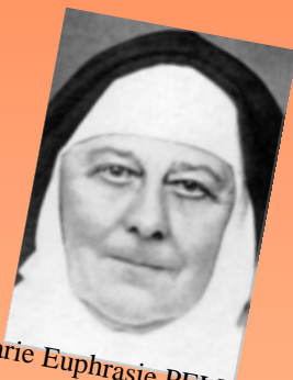
Sainte Marie Euphrasie PELLETIER