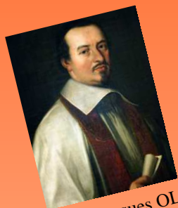
Mr Jean Jacques OLIER