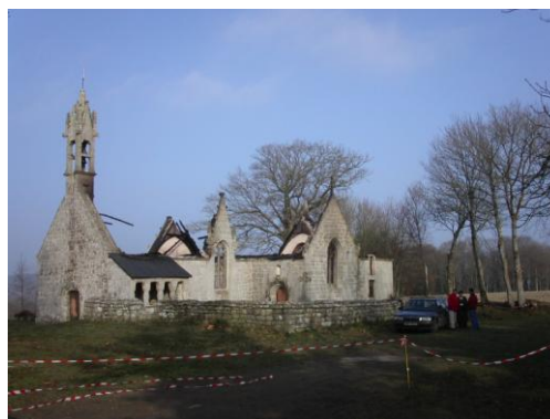
Pour la restauration intérieure et culturelle de la chapelle Saint Guen en Saint Tugdual

La Fraternité chrétienne des personnes malades et handicapées accueille cette année à Allaire pour une messe et un repas. Contact : 02 97 42 99 64